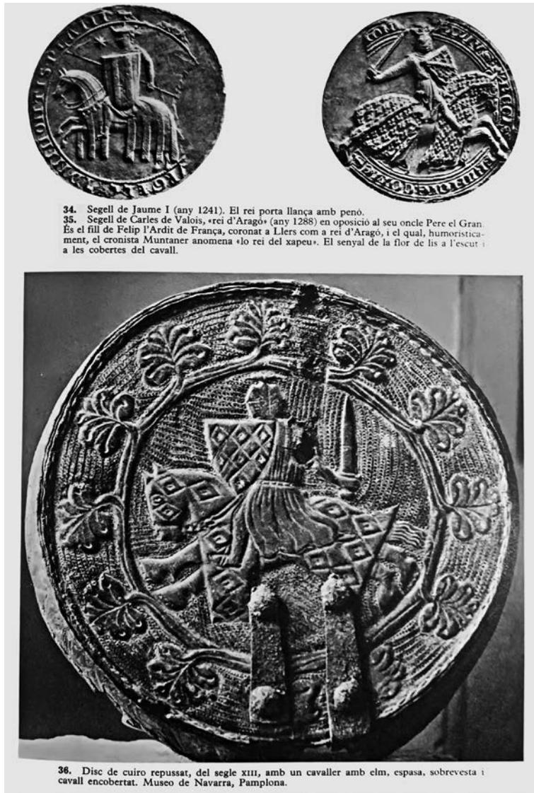
FIGURE 2. Use of seals for a comparative argument by Martí de Riquer, L'arnès del cavaller , (1968), p. 44.

Godoy published their Arquitectura romànica a Catalunya (Martorell Prize in 1907) in 1909-1918; and Antoni Rubió i Lluch's (1856-1937) opus, Documents per l'història de la cultura catalana mig-eva , published by the Institut d'Estudis Catalans in two volumes (1908-1921), just to cite some of the figures with the closest affinity to our discipline.