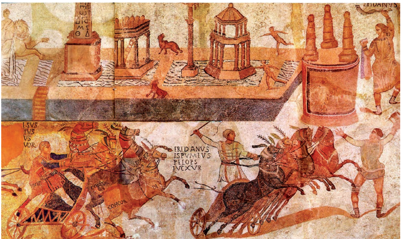
FIGURE 4. The Circus mosaic. Fourth century AD. 7.98m x 3.53m. (Museu d'Arqueologia de Catalunya, Barcelona).

We must now mention an exceptional site due to the quality and characteristics of its mosaic and the enormous difficulty in reasonably interpreting its location. It is a princely work conserved in the villa of Centelles ( Centumcellae ) in Constantí, in the suburbium of Tarraco . This mosaic covers the hemispherical dome of a huge room,