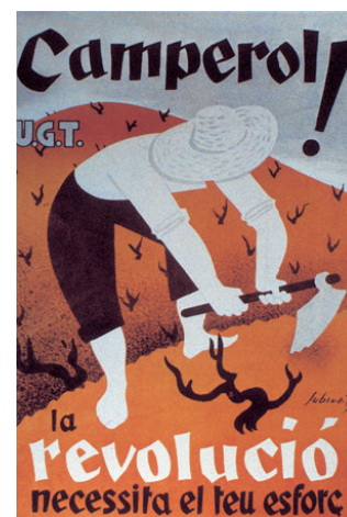
FIGURE 4. Poster by Josep Subirats Samora (1936). The slogan 'Camperol, la revolució necessita el teu esforç!' (Peasant, the revolution needs your effort!) makes clear the need to stimulate agricultural production, while at the same time glossing over the dramas of collectivisation in the countryside and the problems of land ownership. 100 x 70 cm. Col·lecció Cartells del Pavelló de la República (Barcelona).