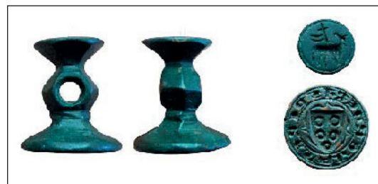
Matrix of a seal and counter-seal of the chevalier Pere Saverdera (thirteenth century) found on Menorca (XI Jornades d'història local i patrimoni cultural de Menorca, 2015: Museu Municipal de Ciutadella) (p. 40)