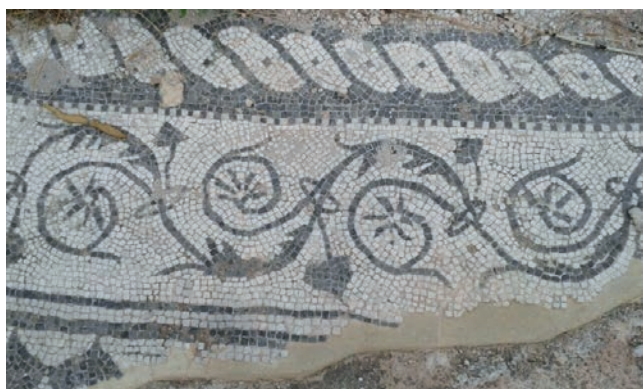
FIGURE 5. Detail of the mosaic of the Basilica des Fornàs de Torelló (Menorca). Sixth century AD (Photo: Museu de Menorca, Mahon).

It goes without saying that this way of covering some graves must have arisen in North Africa, where the custom is well documented from the fourth century onward. Here, we find examples scattered about, yet always in moderation. It must not have been an unfamiliar way of working, yet nor was it very widespread or common. Some of these grave laude boast notable quality, such as some pieces in the cemetery of the holy martyrs Fructuo-