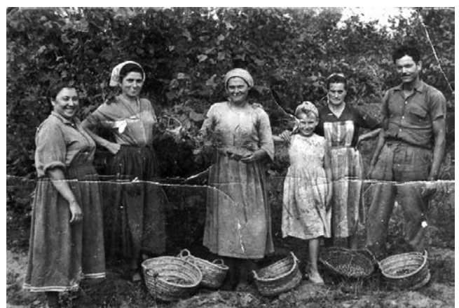
FIGURE 2. Hazelnut pickers.

What transpired in the Penedès winegrowing regions is very significant, as the wineries were built later than in