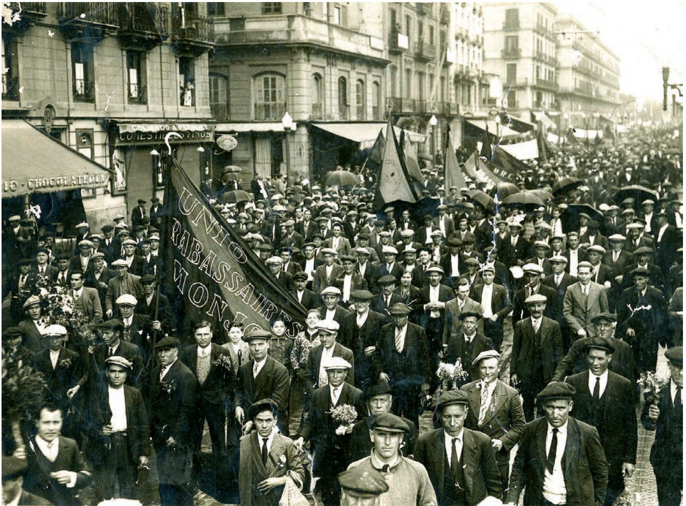
FIGURE 3. Demonstration by the Unió de Rabassaires to defend the Law on Farm Contracts, 1934.

which could not exceed 4% of the land's value. The most controversial aspects was the right for family units that had farmed it for more than 18 years to possibly acquire the land in instalments.