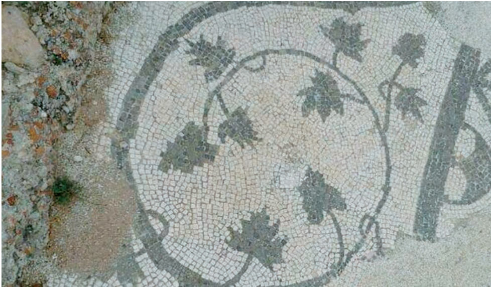
FIGURE 3. Detail of the mosaic of Centcelles (Banys de la Reina, Calp, Alicante). Third century AD.

A bit further northeast and from the Augustan period, the large domus no. 1 had several rooms with floors of crustae which were in use until the end.