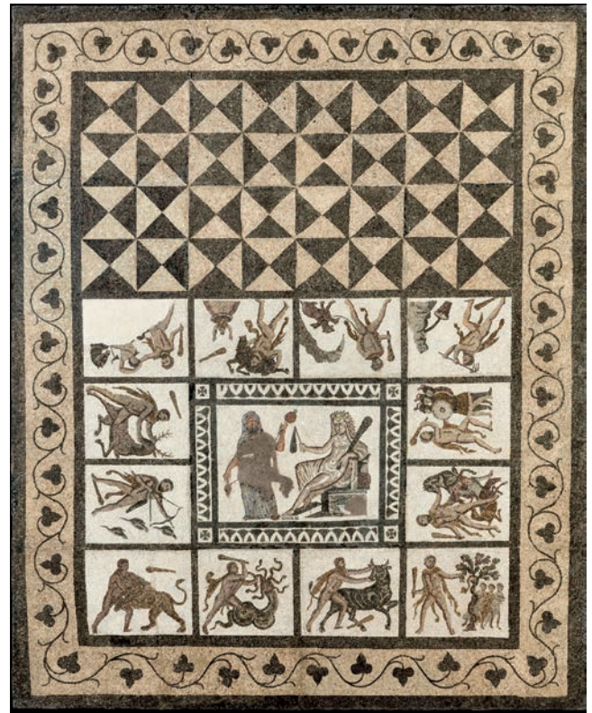
FIGURE 1. Omphale and Heracles and the 12 labours. Edeta (Llíria, Valencia). Third century BC. (Photo: Museo Arqueológico Nacional, Madrid).

In suburban settings, we should mention the huge floor depicting the labours of Heracles narrated in 12 frames around a (false) emblem illustrating the story of Omphale and the son of Alcmena cross-dressing. As often happens, the physical qualities of the mosaic (sizes, colours, layouts, etc.) have nothing to do with its aesthetic quality, which is rather modest. The area with the figurative decoration was preceded by a rather large black and white geometric design. We can assume that this duo signalled the room's main purpose, 49 and we seem to witness a display of the customer's erudite irony by placing the representation of the lamentable cross-dressing story, where Heracles' prestige was undermined, in the preeminent position, in the midst of outsized gestures by the fabled main