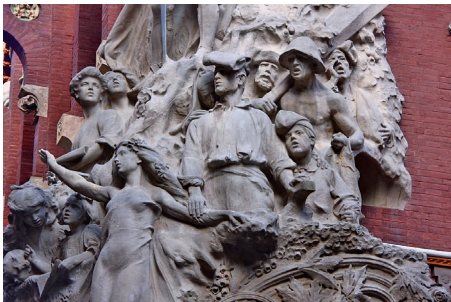
FIGURE 1. Miquel Blay's sculptural group (The Catalan Song) symbolising Catalan music on the corner of the façade of the Palau de la Música Catalana (1909).

Millet upheld the need to recover and share folk songs and to study them by comparing them with those from