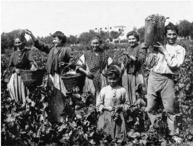
FIGURE 1. Peasants at the grape harvest (c. 1910).