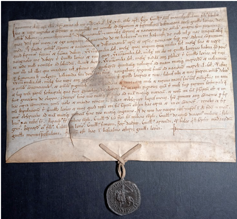
FIGURE 1. Pendant lead seal on a document from April 1168 granted by William VII of Montpellier (Arxiu de la Corona d' Aragó, Chancery, Parchments of Alphonse I, 56).

on the Iberian Peninsula 11 with extraordinarily useful syntheses 12 and general reflections. 13 The main corpuses in Spain are at the Archivo Histórico Nacional, 14 the Museo Cerralbo, the Museo Nacional de Artes Decorativas and the Fundación Lázaro Galdiano. 15 Regionally, Navarra's corpus of mediaeval seals stands out. 16 Two colloquia were held that brought together different contributions, but they have not continued. 17 In 2016, Ernesto Fernández-Xesta published a brief handbook 18 which complements its 1996 counterpart by María Carmona de los Santos. 19