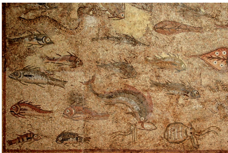
FIGURE 2. Detail of the mosaic dels peixos (fish mosaic) (La Pineda, Vila-seca). Third century AD.

fied. It has been dated from around AD 200, and its composition is calculated to contain around 280,000 small tesserae. 52