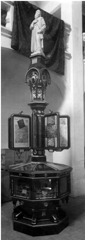
Barcelona Universal Exposition, 1888, display of the seals of the Societat Arqueològica Iuliana (Butlletí de la Societat, 1888) (p. 30)