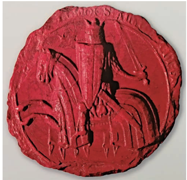
FIGURE 3. Red wax seal of Alphonse the Liberal (1327-1336) from the Cabot donation (MNAC Gabinet Numismàtic de Catalunya)